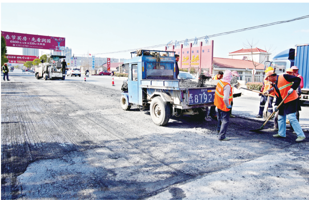
3月22日,公路站的施工人员在人民北路进行路面检修作业。据了解,区交运部门组织人员抢抓时令,加强春季公路养护,强化日常管理,及时处置路面障碍物,使全区公路始终保持良好的路况,确保群众出行通畅。

做好四类困难对象、重大工程拆迁及国省干道、铁路沿线300米范围内破旧房屋的搬迁新建工作,不断提升居住质量。加大农村土地流转力度,有重点地对国省干道、铁路沿线300米范围农田以及30户以下自然村庄周边农田进行流转,着力解决进点农户的后顾之忧。加快建设速度,进一步确定“任务书”、制定“时间表”、明确“路线图”,在抓好现有14个集中点建设扫尾的基础上,新建17个集中居住点,改造提升21个规划发展村庄点。把集中居住点建设和美丽乡村建设结合起来,实现通路、通电、通水、通网络和硬化、美化、绿化、现代化目标。按照特色田园乡村建设要求,尽力保留林木、河流等乡村元素,留住乡愁,倾力打造错落有致、生态宜居的新村庄。