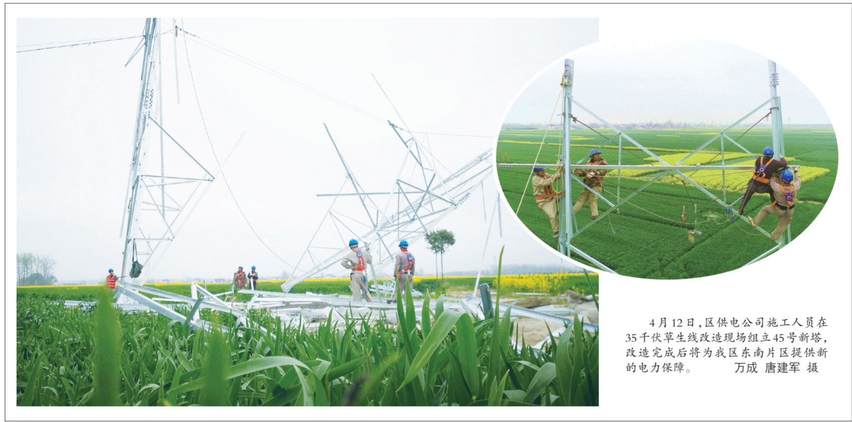
4月12日，区供电公司施工人员在35千伏草庙线改造现场组立45号新塔，改造完成后将为我区东南片区提供新的电力保障。

委副书记牵头，4名服务人员坐阵。建设中项目方根据实际提出规划修编，该镇服务人员主动出面邀请有关专家实地勘察，并帮助修编，为项目快速推进创造条件。都市环保二期在推进过程中，投资方提出，企业规模扩大，原料供应可能有缺口，堆场场地可能不足。该镇立即组织全镇各村居根据企业需要，早日着手做好春季秸秆回收准备工作，并协同企业扩建原料堆场，保证企业二期上马后能高效率满负荷运转。据统计，今年该镇共为12个在建项目化解各类建设和生产难题26个，从而保证了所有项目都能快速高效建设。(李宏俊)