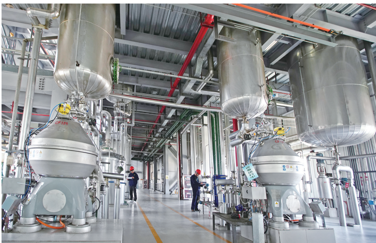
4月17日,江苏佳丰粮油食品产业园的生产车间内,工作人员正在巡检设备。据了解,该公司主动对接上海,与光明集团7个农场达成合作,机械化种植9200亩油菜,从原材料上保证食用油品质。进口德国现代化生产设备,从生产上保证食用油品质。引进专业技术人员,完善检验检测设施,从检测上保证食用油品质。

本报讯 4月18日,大丰110千伏扬帆变输电工程建成投运。 大丰110千伏扬帆变输电工程位于沪苏大丰产业联动集聚区,总投资5202万元,总占地面积3278平方米。本期新建110千伏扬帆变一座,全户内布置变电站,电压等级110/10千伏。工程规划建设3台5万千瓦安主变,本期建设2台5万千瓦安主变,110千伏出线4回,本期建设4回(其中2回备用),10千伏出线36回,本期建设24回。 沪苏大丰产业联动集聚区是沪苏两地重点项目,集聚区面积33平方公里,区域负荷有突破性增长,电力需求将会日益显著。该工程于2018年3月开工建设,今年4月15日通过竣工验收,工程投产后,可为所有入驻园区的企业提供强有力的电力供应保障,提升园区承载重大项目的能。 (唐建军 王帅)