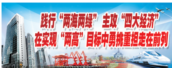
践行“两海两绿”主攻“四大经济” 在实现“两高”目标中勇挑重担走在前列

走进沪苏大丰产业联动集聚区，占地近90亩的智能制造产业园建设现场，6幢标准厂房拔地而起；江都路、扬帆变电站等园区配建工程已经建成；“两横四纵”6条主干道绿化、亮化工程及各类管网建设同步推进，确保年内竣工……一座“北上上海·临港生态智造城”正在强势崛起。 全面加快规划对接，深化完善总体规划，明晰产业定位、发展方向、空间布局，提升竞争优势，以规划引领集聚区高质量发展。该集聚区作为“共建共享共赢”合作新模式，已被纳入《长三角地区一体化发展三年行动计划》；国家即将出台的《长江三角洲区