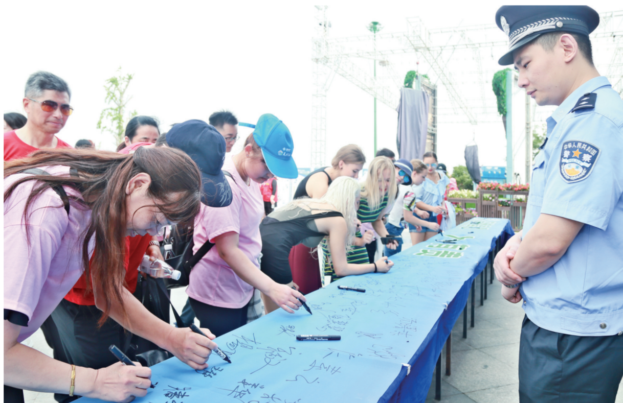
6月25日,由区委政法委、区公安局、区禁毒办、新丰镇联合举办的国际禁毒日集中宣传活动,在荷兰花海景区举办。本次活动以“绿色出行、健康无毒”为主题,通过设置禁毒宣传展板、展示实物、发放宣传手册、现场宣讲、条幅签名等形式,帮助广大市民及游客进一步了解毒品知识、毒品危害,增强识毒、防毒、拒毒意识。