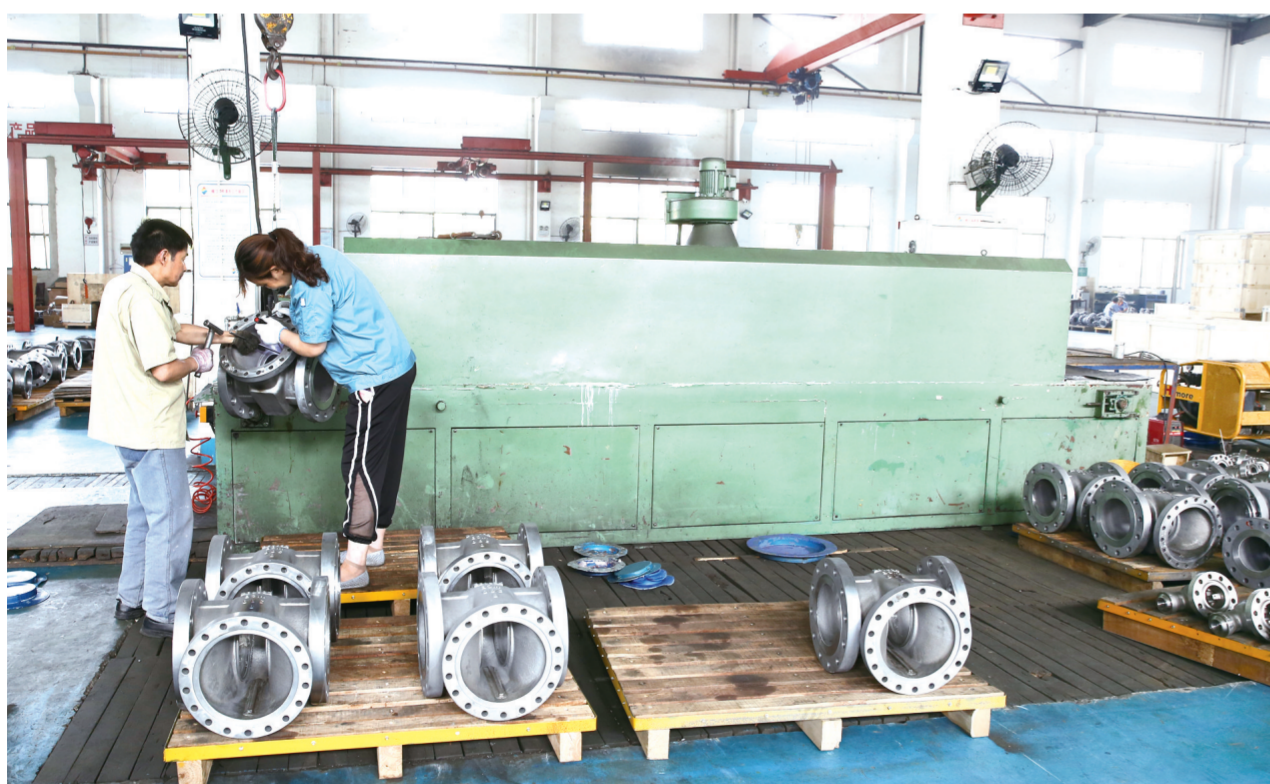
6月24日，盐城思达德民阀门公司生产车间内，工人在机台前忙碌。该公司是一家从事各类阀门生产销售的国家级高新技术企业，专业从事闸阀、截止阀、球阀等产品的生产。今年以来公司不断加大技改投入，投入121万元新上10台数控设备，促进了加快发展。

群众住房条件工作与脱贫攻坚、“不忘初心、牢记使命”主题教育等相结合，优先推进新型城镇化，引导有条件的农民进城入镇居住，优先实施脱贫攻坚，加快改善低收入农户的住房条件，优先推进农村危房和“空关房”改造，确保房屋安全可靠。要坚持农民主体、尊重群众意愿，激发群众集中居住的内在动力，逐步引导群众实现集中居住。要坚持因地制宜系统推进，狠抓当前重点工作。强化设计引导，农房改善要充分体现乡村风貌特色，重点实施基础设施及公共服务配套建设，将农房改善与产业就业相结合，统筹推进研究明确相关政策，将有限的资金用在刀刃上，用在兜底政策上，留给真正需要的人群。要强化组织领导，凝聚工作合力。坚持党政同责齐抓共管，主动担当作为，相关部门要加强指导督查，严把工程质量，严守工作纪律，强化项目、施工、资金监管，努力把这项工作打造成人民群众满意的民心工程、实事工程、暖心工程。 区领导郭超参加活动。（杨燕）