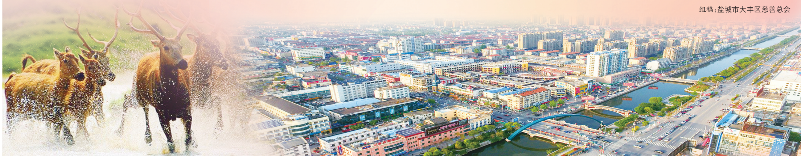
组稿:盐城市大丰区慈善总会