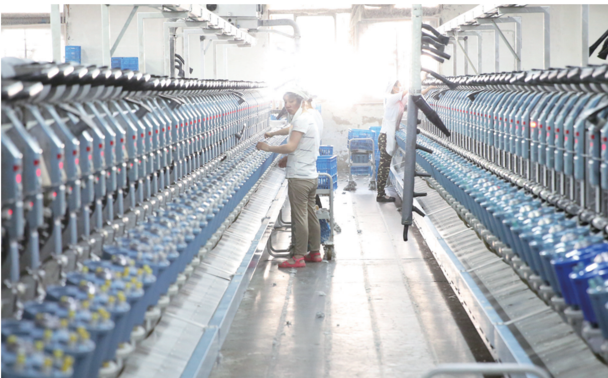
8月30日,盐城海悦纺织有限公司生产车间内,工人在赶制订单产品。今年以来,该公司针对时间紧、任务重、客户要求高的实际,以抓实抓牢的务实举措,满负荷推进生产,从严把控产品质量,严抓生产环节,确保产品经得起检验,客户满意度不断攀升。