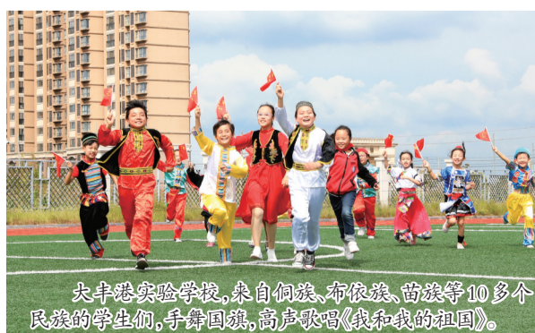
大丰港实验学校,来自侗族、布依族、苗族等10多个民族的学生们,手舞国旗,高声歌唱《我和我的祖国》。

10月1号是新中国成立70周年。连日来,我区各学校纷纷开展“歌唱祖国”、“我和国旗合个影”、“摆出70造型”等形式多样的活动,抒发爱国情怀,用他们独特的方式,表达对祖国母亲的深深祝福。