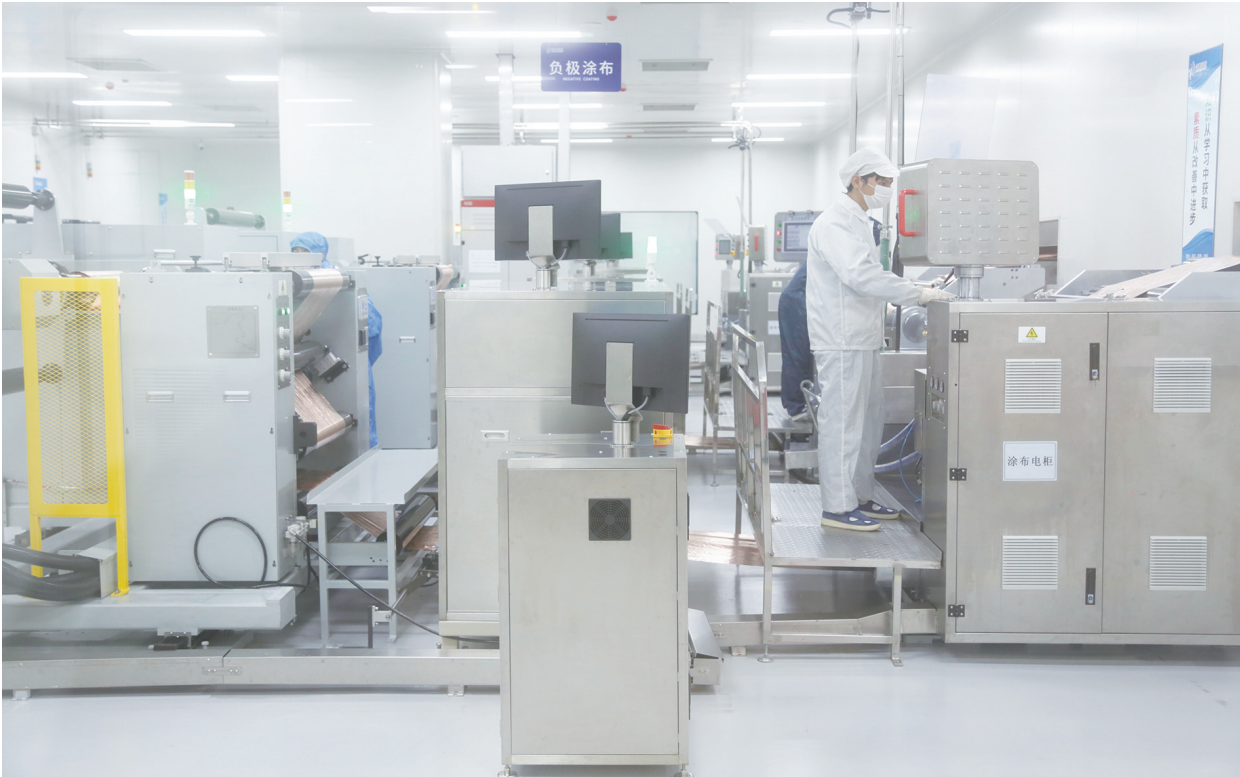
11月29日，江苏丰盈科技有限公司内，技术人员在赶制订单。据悉，总投资30亿元的丰盈锂电池项目首批4条全自动生产线和1条柔性PACK线已安装调试完毕，目前第一条生产线已正式投产，项目全部投产达效后，将实现年开票销售45亿元。