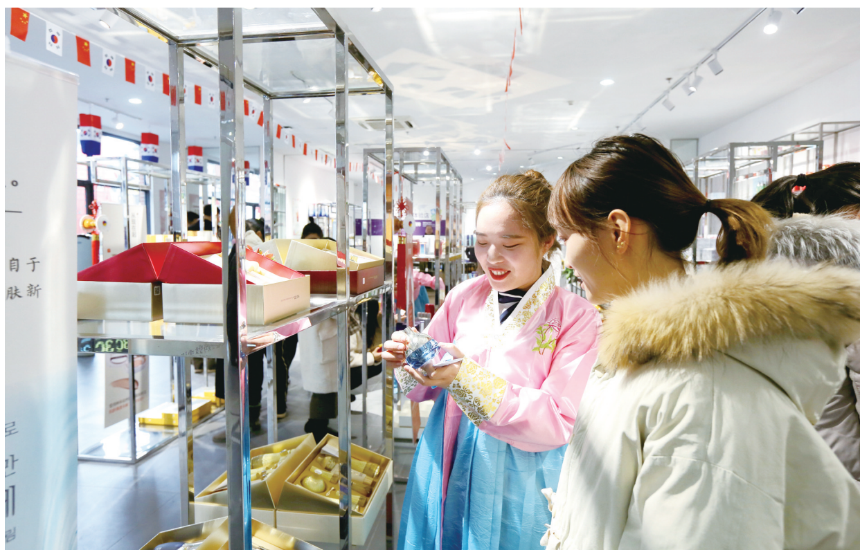
近日，“大丰海港韩品荟”正式开业。该项目致力于打造特色韩国商品集散地，对我区进一步加强对韩合作，强化对韩贸易，带动沿海服务业、旅游业的发展具有十分重要的意义。项目全部建成后将划分服装、美食、化妆、日用、家居、休闲娱乐六大功能区，汇集B保中心、酒吧、韩国潮牌服装、美妆配饰等业态，将成为盐城地区乃至辐射周边城市的韩国商品销售中心。