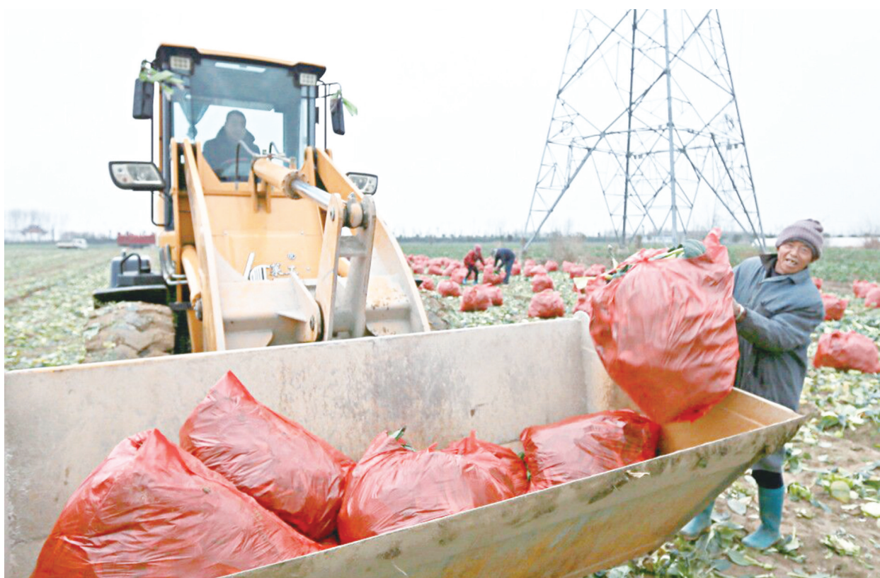
近日,万盈镇益民村的一处蔬菜种植基地内,村民们在收割青菜,这些青菜发往加工厂进行清洗、脱水,供应食品生产企业 and 外贸出口。近年来,该镇不断加大农业结构调整,积极引导农民发展蔬菜种植,打造现代农业示范基地。

此外,投资5000万元的城东农贸市场竣工,解决了城东市民买菜难的问题;投资9000万元的餐厨垃圾处理中心主体竣工,设备正在安装调试,全区垃圾分类工作得以更好地实施;常新路小学、初中和大丰外国语学校、天气雷达工程等稳步推进……我区坚持以人民为中心的发展思想,在群众反映强烈的就业、教育、医疗等民生问题上出实招、解难题,不断满足人民群众对美好生活的向往,为推进全区高质量发展提供了有力民生保障。