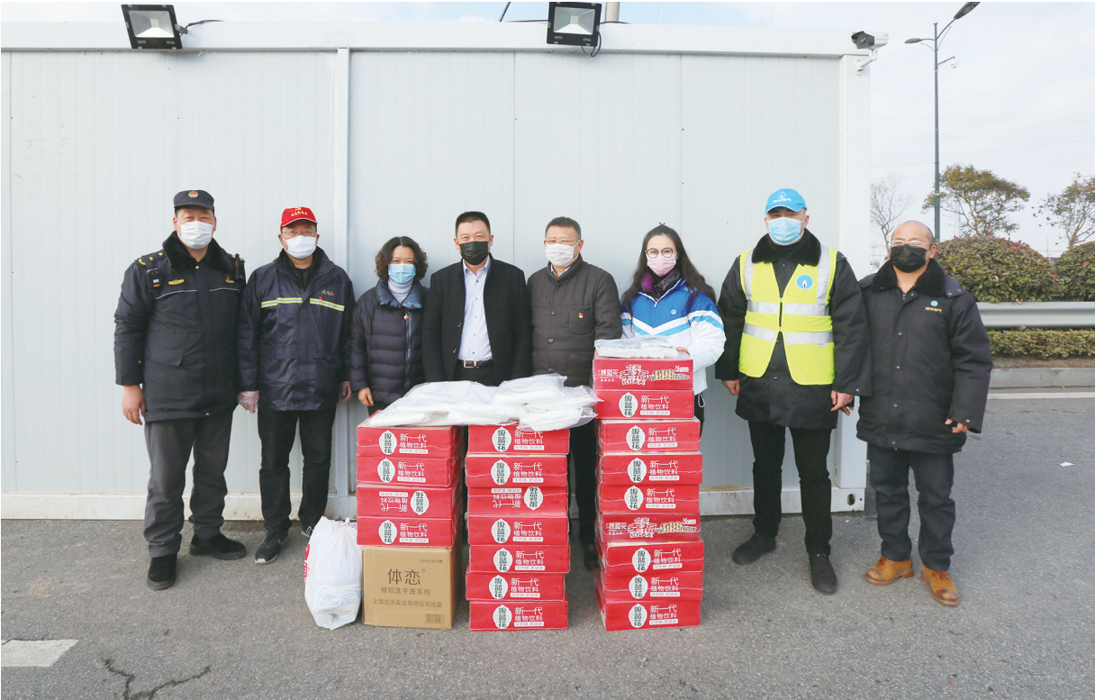
2月12日,港华燃气公司向港区疫情防控点捐赠医用口罩、防护服、毛巾、洗手液等物资,有效缓解港区疫情防控一线工作人员的燃眉之急。

情面前,保障医院的供电是关系到人民群众生命安全的大事,为了做到万无一失,他们加大巡查,由原来的每周巡查一遍供电设施到现在每天巡查两遍,坚持做到从变电所到医院配电房,不留死角,逐一排查可能存在的隐患,重点监测医院现场的用电情况及医院配电房的配电设施。同时利用红外线测温装备,在不停电的情况下及时发现问题及隐患,做到防微杜渐。医院配电房专门配备可以进行双电源切换的配电装置,将意外情况降到最低。