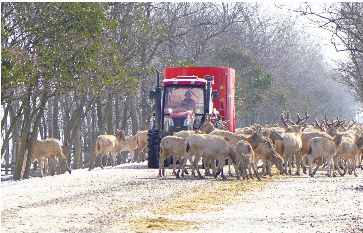
2月16日，大丰麋鹿国家级自然保护区的自动投料搅拌车在野放麋鹿活动区域投放草料。据了解，随着麋鹿种群数量不断增长，该保护区在冬季来临前提前收贮青贮饲料，平均每天早晚投放20多吨，保证每头鹿5公斤的草料，帮助鹿群安全越冬。