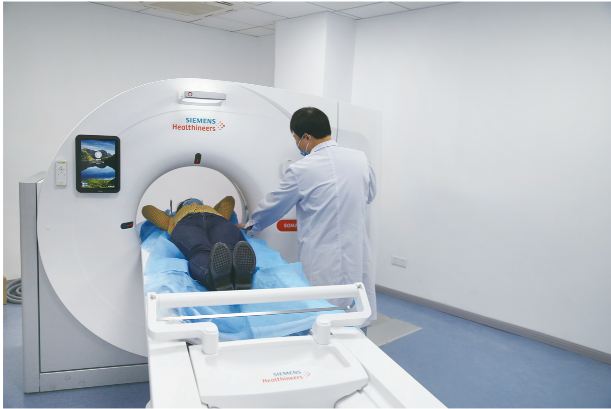
近日，区人民医院购置价值380万的32排64层CT，专用于发热患者检查，杜绝发热患者和其他患者交叉感染。设备从机房准备到安装完成不到两周时间，已正式投入使用。该CT具有图像清晰、扫描速度快、操作方便、放射剂量低等特点，检测一名患者只需要5分钟时间。