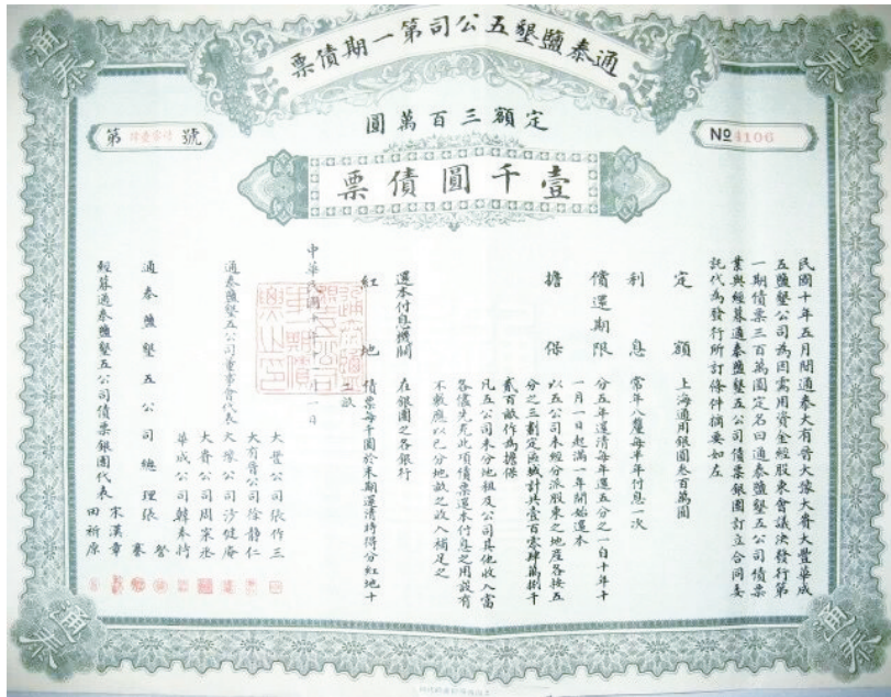
通泰五公司发行的第一期债券

示,中国金融界将全力支持以大丰公司为中心的淮南垦植事业,以振兴民族纺织工业。回到上海后,他邀集沪上各银行负责人及钱业领袖秦润卿,议定上海银行公会与钱业公会全面合作。参与当时银团债券发行工作的有盛竹书(时任上海银行业协会会长)、钱新之(后任上海银行业协会会长)、李馥荪(后任中国银行董事长)、徐寄庠(后任浙江兴业银行董事长)、唐寿民(后任交通银行董事长)等著名金融界人士。银团几乎囊括了近代中国最著名的新式银行及钱庄,即中国银行、交通银行、“南三行”(上海商业储蓄银行、浙江兴业银行、浙江实业银行)、“北四行”中的大陆银行、盐业银行、金城银行3家及福源、永丰钱庄等24家,合组名为“通泰五公司债票银团”,在大丰公司投入100万元企业债票。此次债票的发行,极大地缓解了大丰公司的资金压力,首开中国企业发行企业债票的先河,揭开了中国近代史上第一次大规模的企业债票投资农业的帷幕。