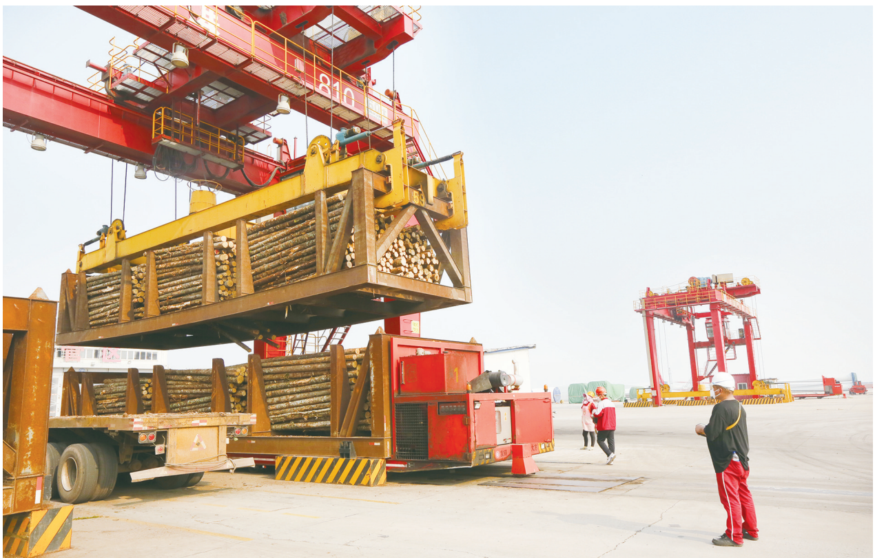
5月28日,大丰港国家级进口木材检验检疫处理区,一批批进口木材在进库进行熏蒸除害。该处理区是国内首个示范性全封闭式木材熏蒸除害处理项目,今年以来已处理来自俄罗斯、加拿大等国家的原木。截至4月,该中心进库熏蒸木材5.2万方。

前列作贡献。要坚持档案姓党,不断提高政治站位,强化制度和业务建设,突出红色资源开发,彰显档案价值。坚持安全至上,确保档案安全。坚持争先创优,开展争第一、创唯一、树品牌活动,做出特色。坚持理论与实践相结合,加大档案工作的探索创新,进一步总结先进成功经验在全省复制推广。 在丰期间,陈向阳参观了荷兰花海党群服务中心和档案馆。(杨蕾)