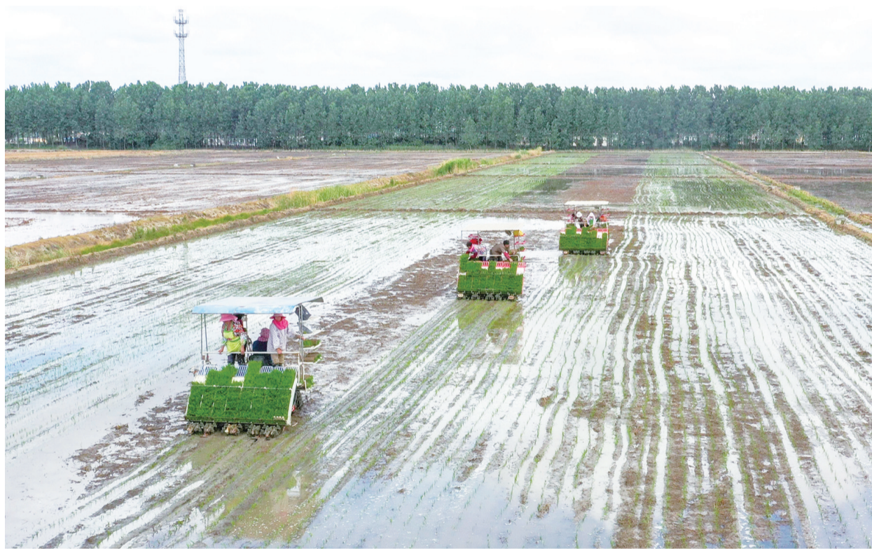
近日，西团镇赵场村的一处稻田里，插秧机在栽插水稻秧苗。目前，我区夏收工作全面完成，夏种工作已全面展开，62.5万亩水稻已经完成种植约42万亩，其中有13万亩采用机插秧。近年来，区农业农村局依托专业化农机合作社，加快农机农艺技术推广普及，大大提高了种植效率，为粮食丰收增产打下坚实基础。