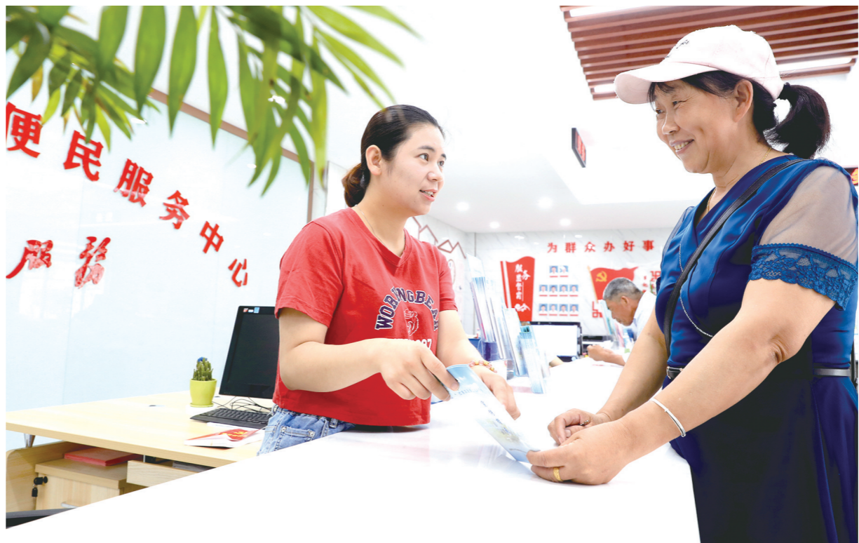
6月12日,在刘庄镇友谊村党群服务中心内,工作人员向村民介绍进城入园相关政策。连日来,该镇加大推进农民进城入园宣传力度,利用宣传车、微信群等多种宣传载体,解读各项进城入园新政策,让更多村民进城购房。

丰富多样的运动方式,让健身从此不再单调。全民健身已经成为一种热潮,越来越多的群众增强了积极健身的意识,拥有了健康的品质生活。