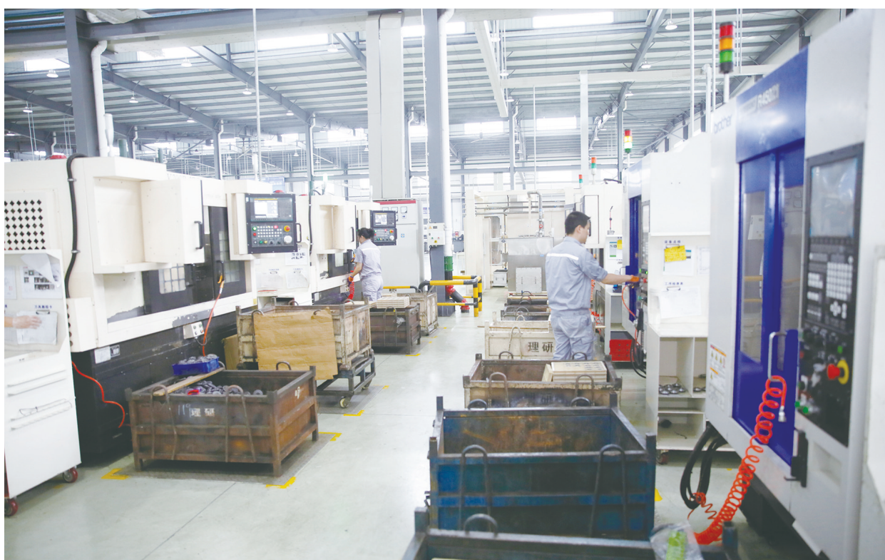
6月29日，江苏理研科技股份有限公司生产车间里，工作人员在流水线上加紧生产。今年以来，公司持续加大技术、设备投入，引进精锻齿轮成品制造及汽车柴油共轨项目，形成年产5500万件齿类产品及年产200万件共轨类产品的生产能力，并与众多国内外知名企业达成合作，产品深受市场好评。

盐通铁路大丰综合枢纽项目1标工程路线全长8.896千米，按照双向六车道设计，主要包含主线桥梁3座、匝道桥4座、路基工程、路面工程、涵洞以及附属设施工程等。G15特大桥为项目全线重点控制性工程，全长2083.08米。项目建设以来，工程人员凝心聚力，积极优化施工方案，倒排工期，积极推进项目生产，全力保障工程建设安全有序推进。该项目建成后，将对盐城范公路南延等盐丰一体化快速通道、大丰高铁扩散辐射、高铁片区基础设施完善具有重大意义，同时加快我区开放沿海、接轨上海的步伐，助推我区经济社会高质量发展。（魏县诚 文世珂）