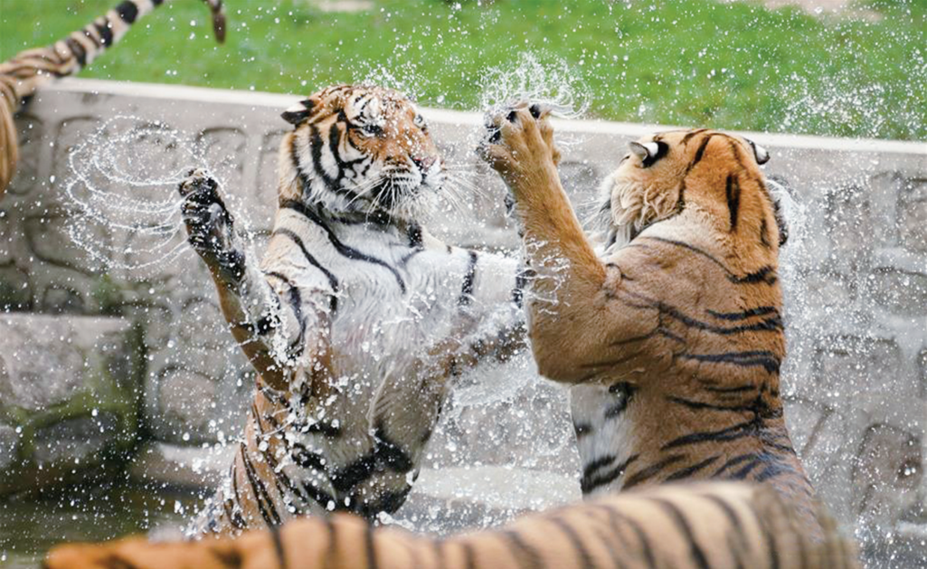
时值盛夏,位于黑龙江省海林市的横道河子东北虎林园的东北虎活动量减少,以不同方式消暑纳凉。图为7月28日在横道河子东北虎林园拍摄的在水中纳凉的东北虎。

在工业和信息化部教育与考试中心主任马晋看来,积极适应相关行业的发展现状,尽快解决日益凸显的人才供需矛盾,是推动行业发展的当务之急。