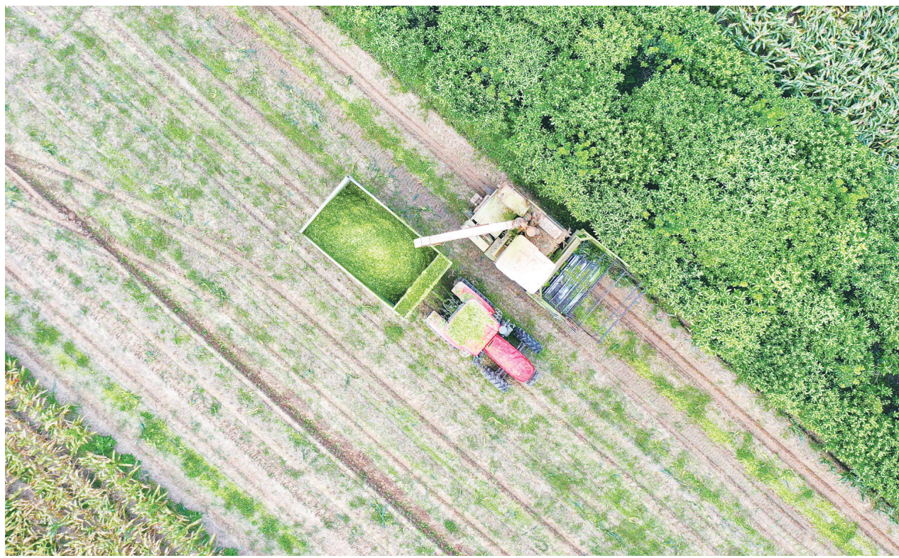
9月27日,大中街道双喜村的一处农田里,大型粉碎机和运输机协同作业,将玉米秸秆粉碎成青贮饲料。近年来,我区在稳定粮食生产的基础上,推广“合作社+农户+企业”模式,引导农民种植青贮玉米,既解决了养殖企业越冬饲料问题,又避免了秸秆焚烧,还增加了农民收入。

借鉴意义,必将为大丰进一步创响农业品牌、提升现代农业发展层次注入新的强大动能。我区将按照专家建议,优化农业农村发展机制,制定操作性强的规划和措施,坚持品牌强农,走市场化、产业化之路,打造特色农业品牌,加大宣传推广力度,共同发力,打响“大丰仓”品牌,全面推进农业农村高质量发展。区领导韦国参加。(宗敬婷)