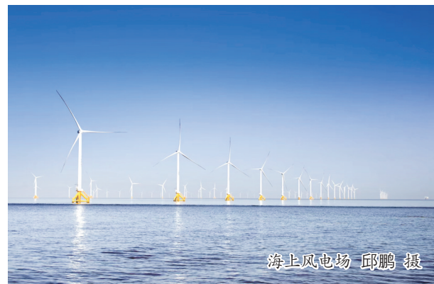
海上风电场

编者按:9月28日,我区新能源产业发展收获了双硕果:盐城工学院大丰新能源产业学院揭牌开班,天合光能10GW光伏组件项目成功签约,为我区打造新能源产业高地、推进全域经济绿色转型注入了新动能。本报从今日起推出系列报道《追风逐日,风景独好》,带你领略大丰新能源产业发展的无限“风光”,憧憬“双循环”新发展格局下的“丰”能未来。