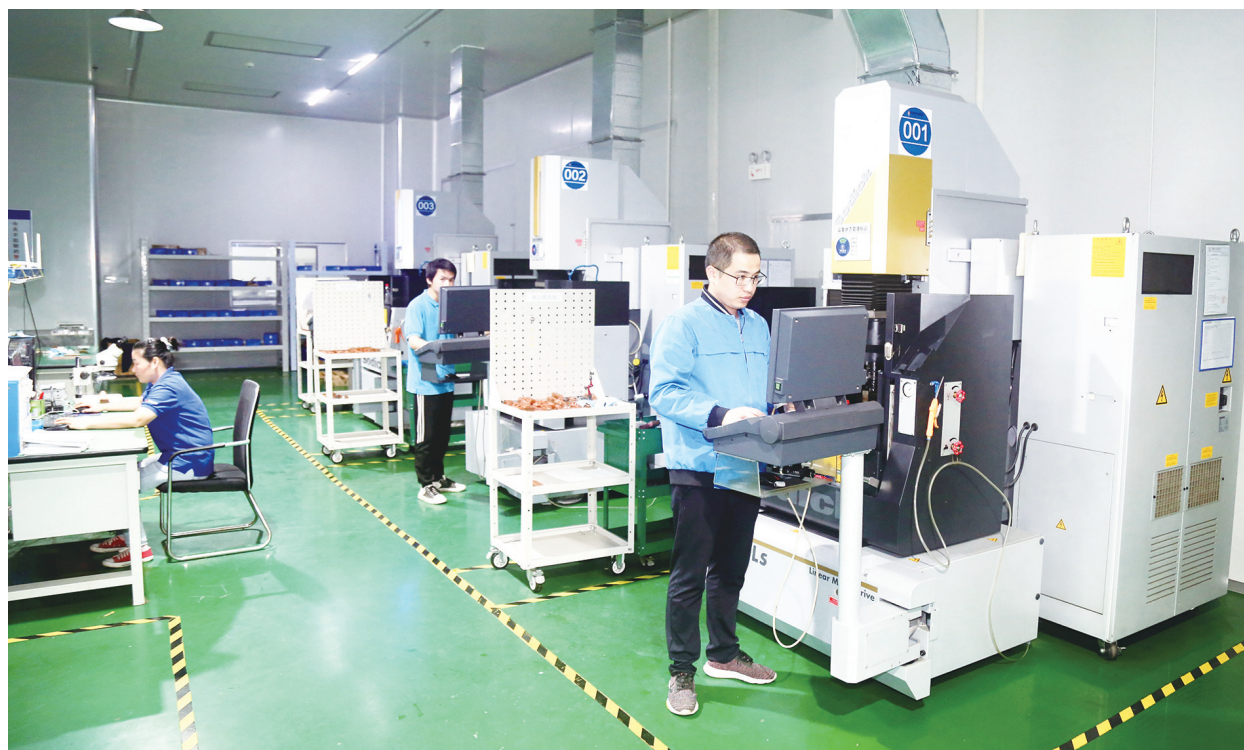
10月14日，江苏通融精密组件有限公司车间内，工人在赶制订单产品。该公司拥有先进的智能自动化生产设备和专业的高素质技术管理团队，专注于精密电子防水零部件、手机防水结构件生产，产品主要用于高端智能手机类、数码相机、军工类、医疗类、汽车类等领域，提供专业的防水、防尘、防摔等产品方案和产品工艺优化。

本报讯 今年以来，区农业农村局紧紧围绕“消除事故隐患，筑牢安全防线”这一主题，深入学习宣传习近平总书记关于安全生产的重要论述精神，不断强化安全红线思维，树牢安全发展理念，从根本上消除事故隐患。 该局重点围绕渔业、农机、农药及畜禽养殖等重点行业领域安全生产法律法规及安全知识等内容，组织编印《安全生产法规制度汇编》和《安全生产应知应会180问》5600本，发放至各单位及相关人员；制作80多条安全生产宣传横幅，发放农机安全操作宣传单8000多份、沼气池日常管理及作业规范专项明白纸5000余份。截至目前，已举办兽药饲料安全生产知识教育培训班8期，开展农机安全知识讲座8期，邀请第三方专业人员对全区15个乡镇（区、街道）养殖户培训480人次。组织相关人员集中观看“321”事故应急处置纪实专题片等视频，深刻吸取教训，推进行业治理体系和治理能力迈上新台阶。（王楼楼 卢定国 高书龙）