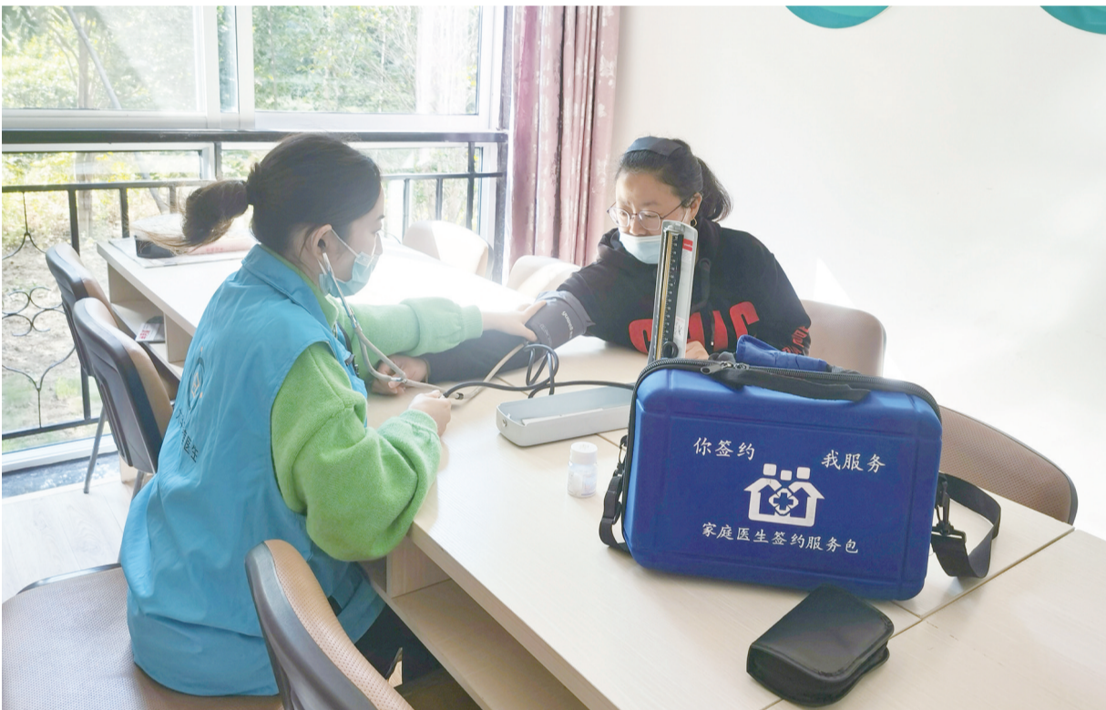
近日,区第三人民医院医务人员在大中街道大华社区新创建的“家庭医生工作室”为市民进行健康体检。该社区成立“家庭医生工作室”,是响应国家医疗分流、医疗进社区的重要举措,将为居民逐步建立起健康档案,并开展上门访视和家庭康复指导等工作,让群众享受家门口的医疗服务。

如今,一个个蕴含历史乡土韵味的农业旅游景点风生水起,魅力无限;一处处展现多姿多彩农业的文化元素,方兴未艾、风景别致。农旅融合,正昂起龙头,行进在圆梦路上。