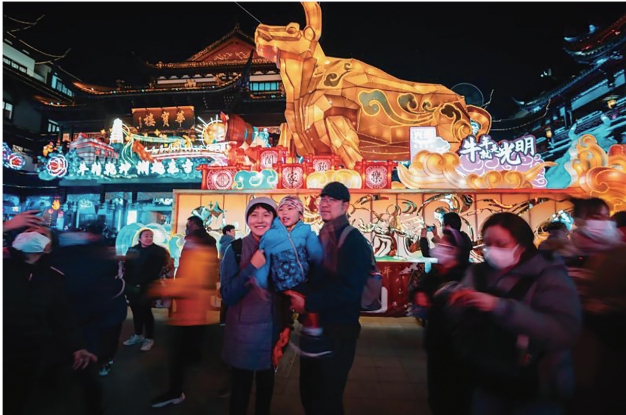
春节假期已过,城隍庙依然人气满满。2月19日,夜幕降临时分,许多游客涌入城隍庙,徜徉在豫园灯会流光溢彩的美景当中。