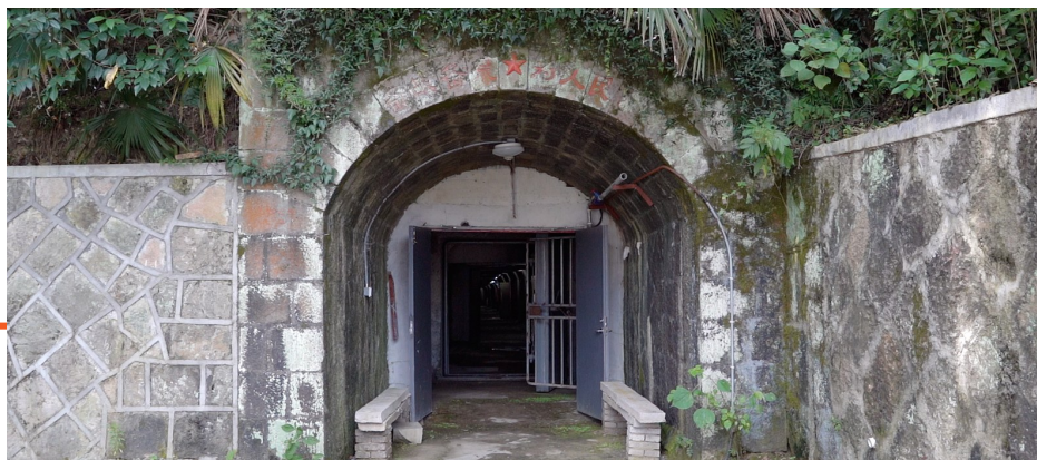
如今的乾元大家山防空洞

德清人防紧紧围绕军民融合发展、创新驱动、跨越赶超,在人防工程建设、指挥通信等方面均实现了新突破。