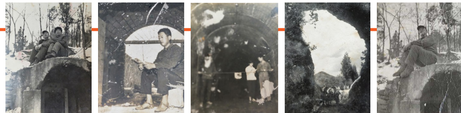
上世纪70年代的大家山防空洞

2016年5月13日,召开第七次全国人民防空会议,中共中央总书记、国家主席、中央军委主席习近平亲切会见与会代表并强调,人民防空是国之大事,是国家战略,是长期战略。事关人民群众生命安全、事关改革开放和现代化建设成果。要坚持人民防空为人民,铸就坚不可摧的护民之盾。要提升履行使命任务能力,提高防空袭斗争能力,有效履行战时防空、平时服务、应急支援职能使命。要转变人防建设发展方式,树立和落实新发展理念,深化改革,推进军民融合,努力实现更好质量、更高效益、更可持续的发展。