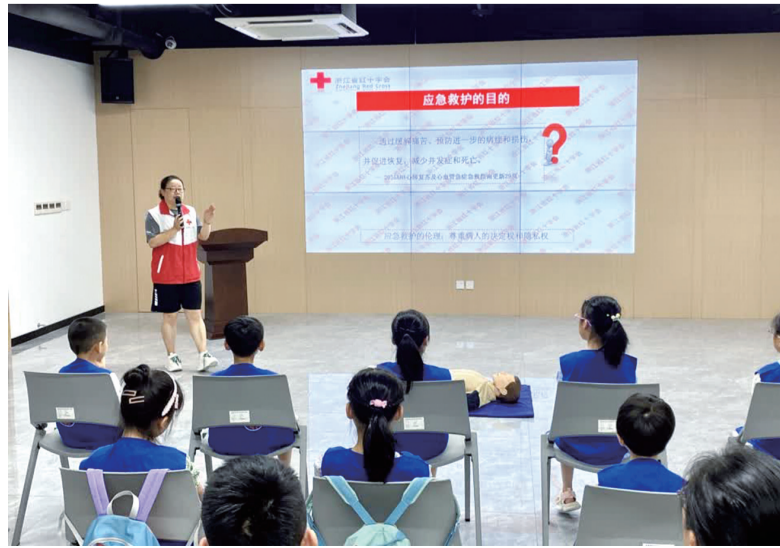
德清县舞阳教育集团舞阳校区开展“预防溺水,安全一夏”小蚂蚁暑期实践活动。