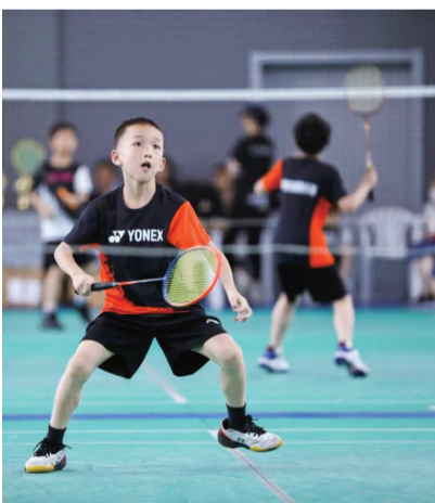
德清县实验学校开展暑期“亮健”行动,孩子们积极响应,参与体育锻炼,增强自身体质。

通过这样的研学之旅,同学们表示,将认真总结在社会实践过程中的所学、所思、所悟,以新时代青年的奋进姿态书写新的人生章程。