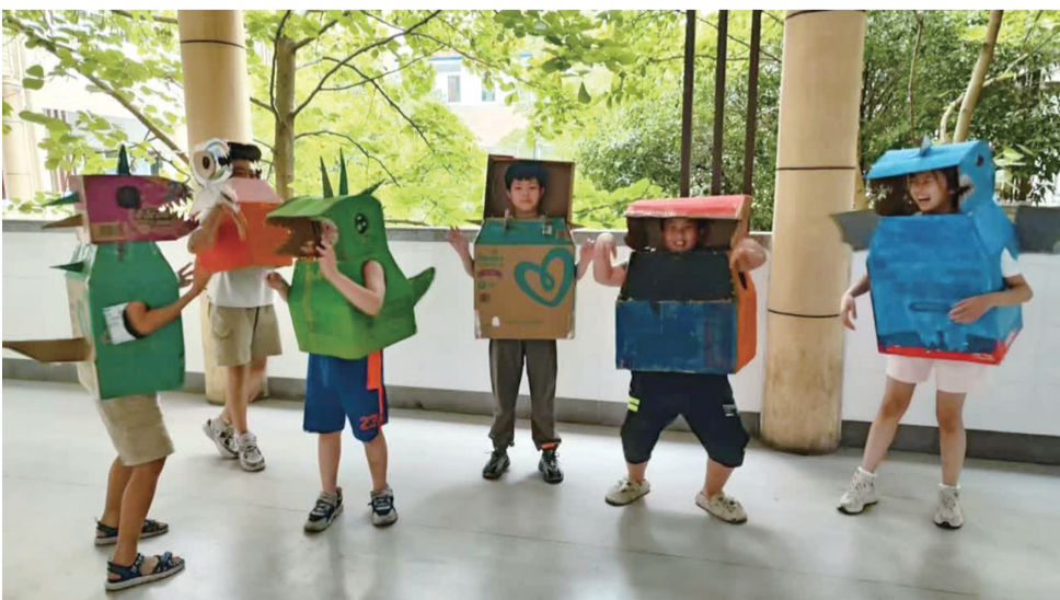
德清县逸夫小学开展多彩暑期托管,学生们利用废弃纸箱,自制五彩缤纷的恐龙。