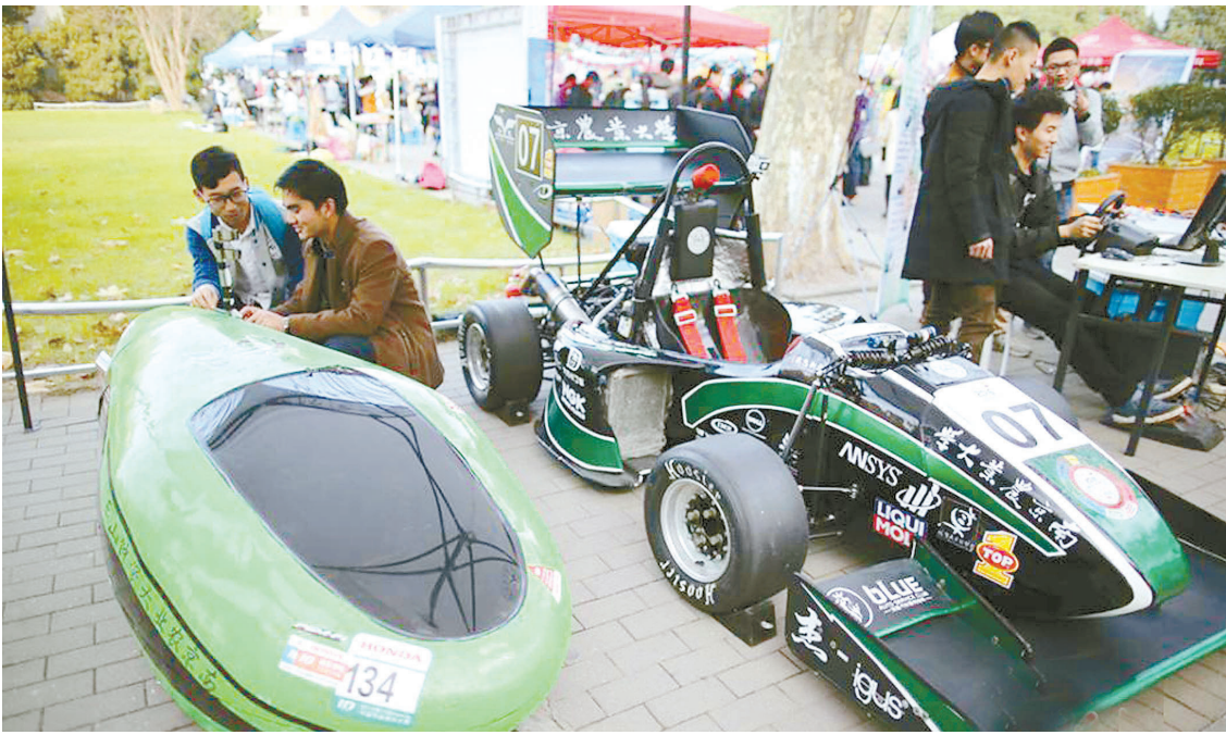
12月7日,南京农业大学工学院大学生设计制造的节能赛车和方程式赛车吸引了众多的目光。当日,以“知我南农,爱我南农”为主题的校园博览会在南京农业大学校园内举行,来自17个学院的大学生们带来动植物标本、动感赛车、茶叶茶道表演等展示,通过展板、游戏等多种方式,激发学生对专业的热情。

据教育部网站消息,教育部近日发布《关于做好2017届全国普通高等学校毕业生就业创业工作的通知》。《通知》提出,引导和鼓励毕业生到城乡基层就业;鼓励毕业生到中小微企业就业;支持高校毕业生到国际组织实习任职;持续做好大学生征兵工作等。 《通知》要求,各地各高校要严格按照就业统计工作要求,通过“全国高校毕业生就业管理系统”及时上报、更新就业信息,确保数据真实准确。认真落实就业签约“四不准”要求,不准以任何方式强迫毕业生签订就业协议和劳动合同,不准将毕业证书、学位证书发放与签约挂钩,不准以户籍档案托管为由劝说毕业生签订虚假协议,不准将顶岗实习、见习证明材料作为就业证明材料。不得发布含有歧视性内容的招聘信息,严密防范招聘欺诈、求职陷阱等。要确保校园招聘等活动安全、有序,防止挤踏等意外事故发生。