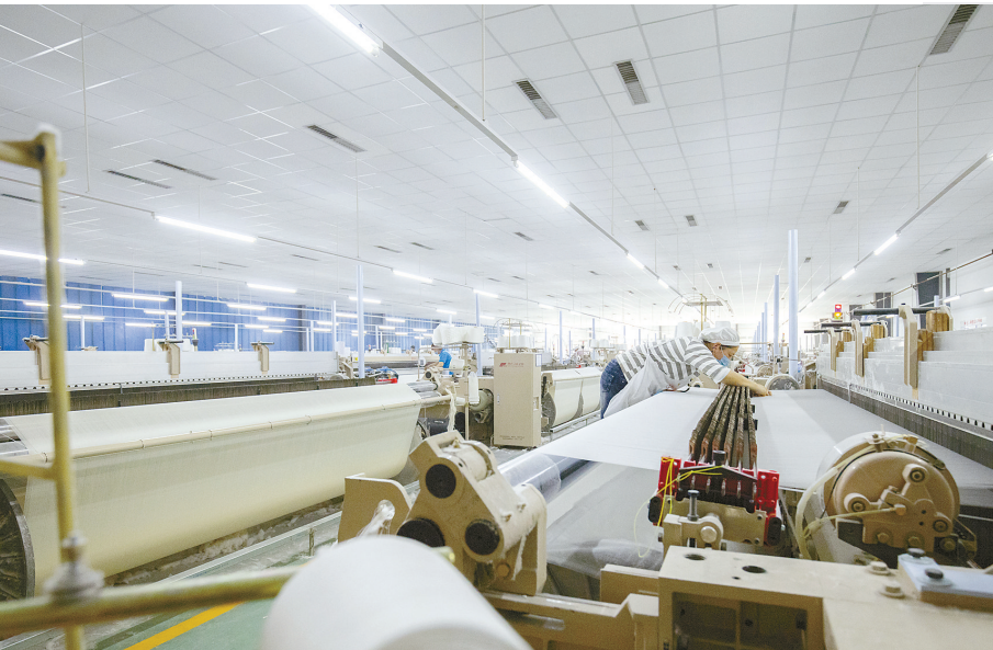
明源纺织新上高科技功能性面料生产线项目,目前,已开发了以天丝、竹纤维等为原料的上百个产品。