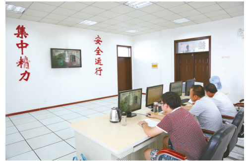
近一段时间持续高温少雨,堤东地区水源供需矛盾突出。市抽水工程管理处加强工程运行值班管理,实行24小时三班轮换值守,安丰、富安、东台三大抽水站连日满负荷运行。图为富安抽水站场景。