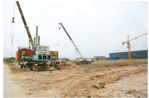
连日来,本善药业项目施工方打足人力机械,快速推进桩基工程施工。