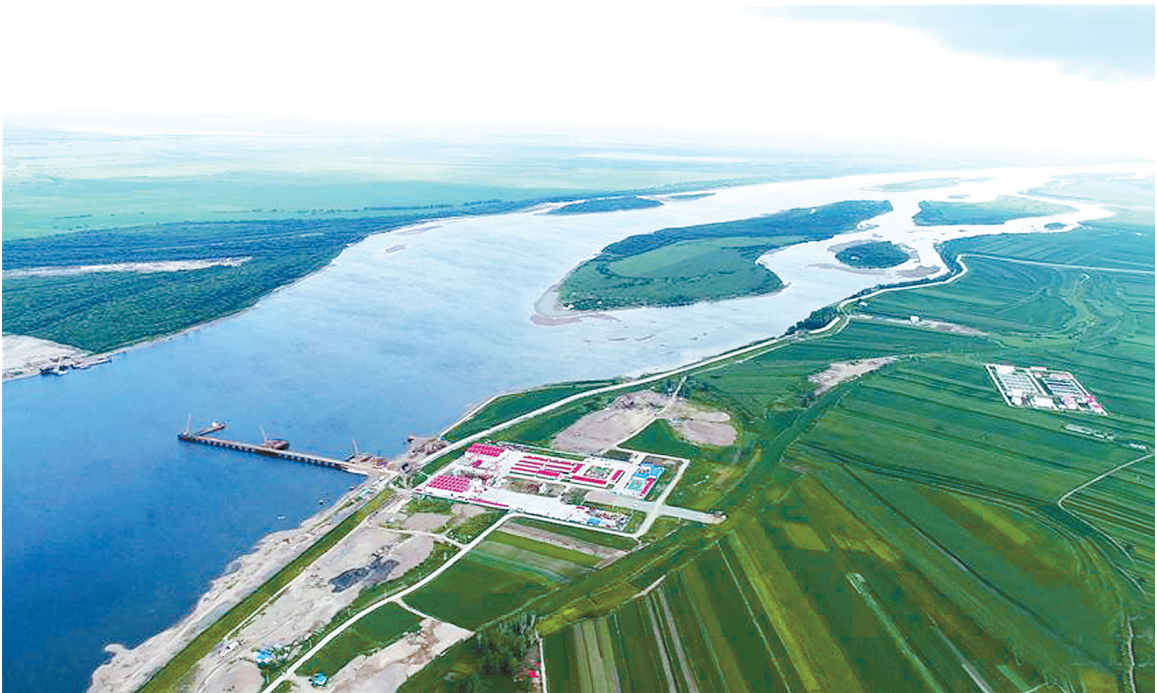
这是施工中的中俄黑龙江大桥。中俄黑龙江大桥是中俄首座跨界江公路大桥。目前,中方施工人员加紧在施工栈道上作业。中俄黑龙江大桥起点位于中国黑龙江省黑河市,终点位于俄罗斯阿穆尔州布拉戈维申斯克市,预计2019年通车。

不过,也有部分副省级城市被其他城市赶超。今年上半年,全国主要城市中,重庆、昆明、南昌、福州增速均在9%及以上,除重庆是直辖市以外,其余4个城市均非副省级。作为副省级城市的大连、哈尔滨上半年增速分别为6.8%和16.6%,低于全国平均增速。