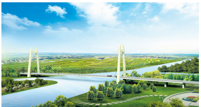
海陵南路跨泰东河、串场河特大桥

229省道改扩建工程：全线路基土方填筑已完成过半。1标段泰东河大桥左幅除南桥台外，桩基全部完成，立柱全部完成，墩台帽完成80%，主桥挂篮悬浇完成3#块施工，左幅箱梁预制46片，完成50%，计划12月初开始安装。2标段3座中小桥全部完成，圆管涵全部完成，6道箱涵完成4道，另2道已全部开工，预计11月份箱涵全部完成。施工中表示，将力争在12月底前完成610省道以南路基土方填筑，年前完成泰东河大桥左幅主桥的合龙。