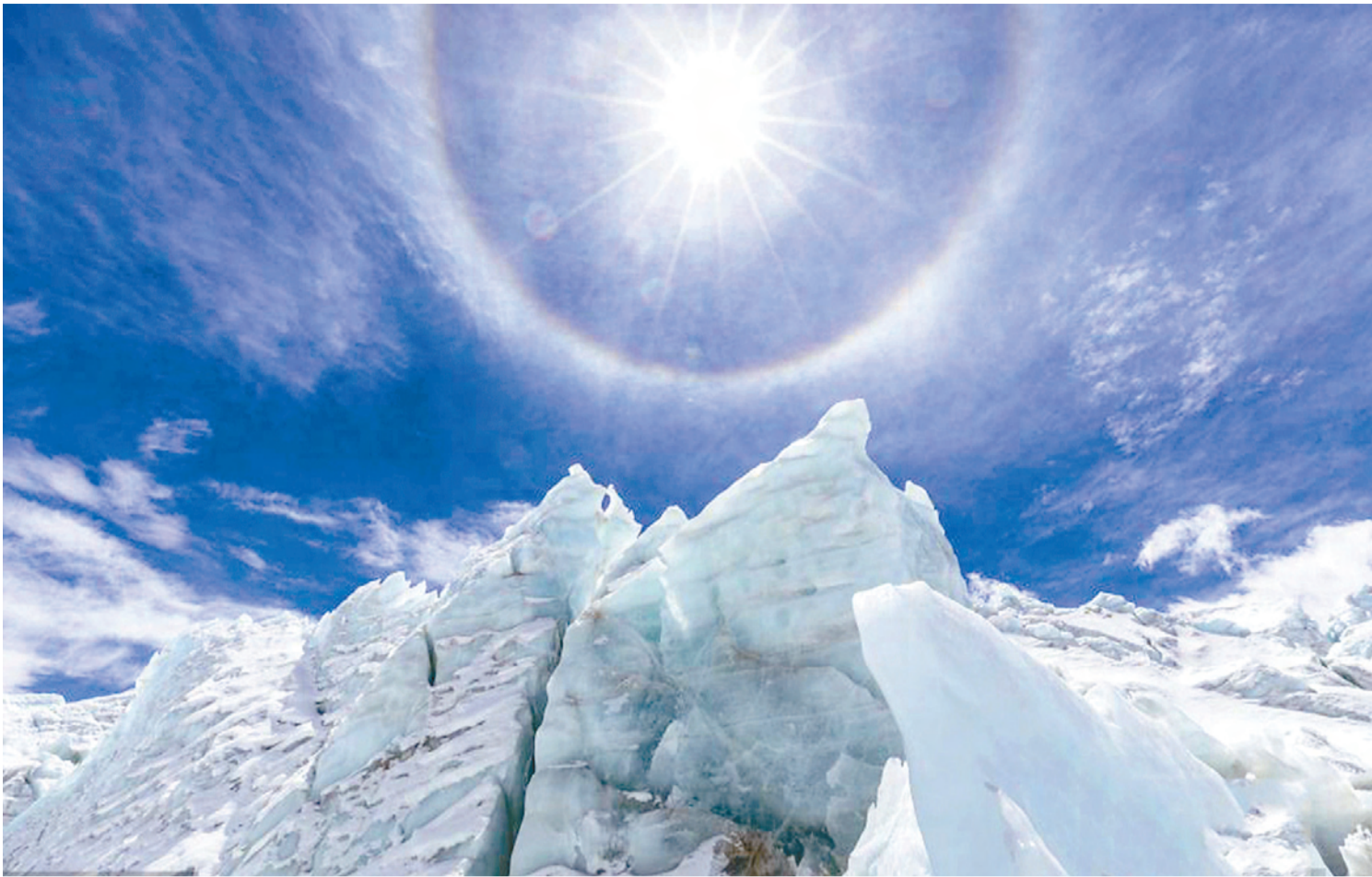
4月10日,西藏著名景点岗布冰川(40冰川)上空的日晕。这是拉萨附近第三天出现日晕。日晕,又叫圆虹,一种大气光学现象,是日光通过卷层云时,受到冰晶的折射或反射而形成的。当光线射入卷层云中的冰晶后,经过两次折射,分散成不同方向的各色光。