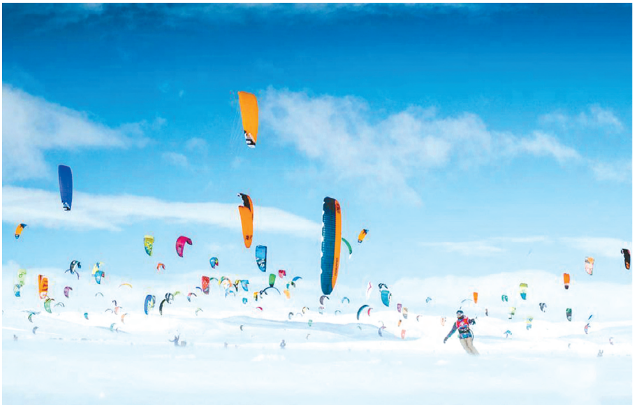
近日,在挪威哈当厄高原,来自30个国家的350多名运动员参加风筝滑雪大赛,赛程100公里,共5圈。参赛者可自由选择使用单板或双板。最终,德国的选手Florian Gruber拔得头筹。