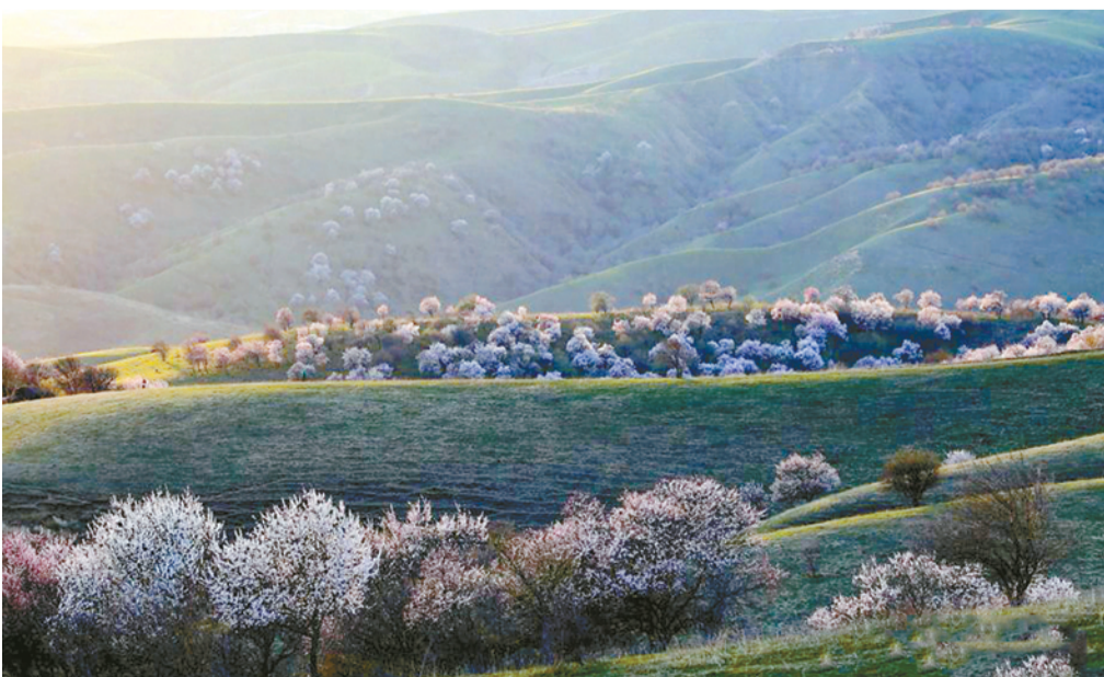
4月11日,新疆天山脚下的霍尔果斯大西沟风景优美,山顶上白雪皑皑,山脚下春意浓浓。千树万树野生杏花飘香,雪山、杏花、绿草、放牧的牛羊群,构成一幅大西北边陲颇具地域特色的季节风景画,令人流连忘返。