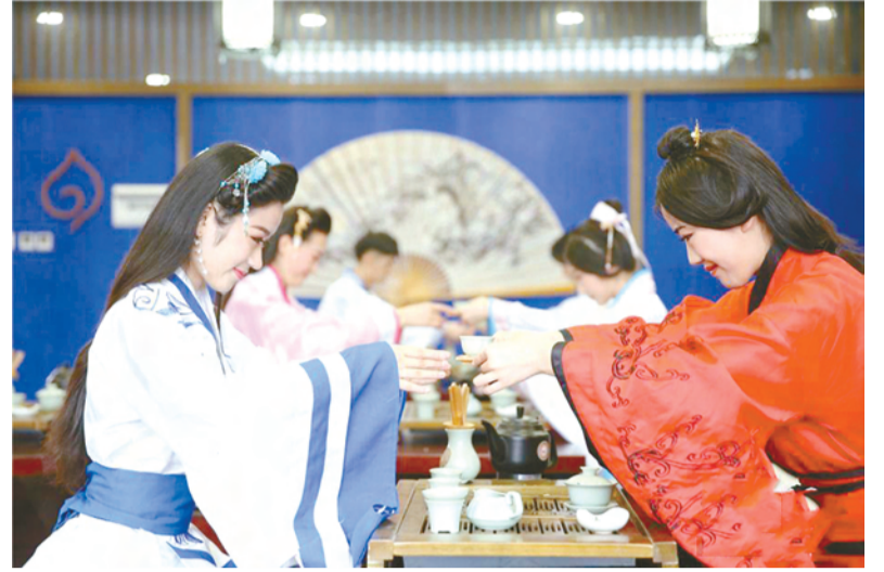
4月11日,第四届“西航天使杯”中国空乘招募大赛在成都落下帷幕,十佳选手也顺利产生。4月12日,十佳选手穿着传统汉服进行茶艺学习,传承中国传统文化。在专业老师的指导下,十佳选手认真细致地学习了冲泡技艺。投茶、高冲、闷茶、闻香等动作一气呵成,举手投足之间尽显优雅。