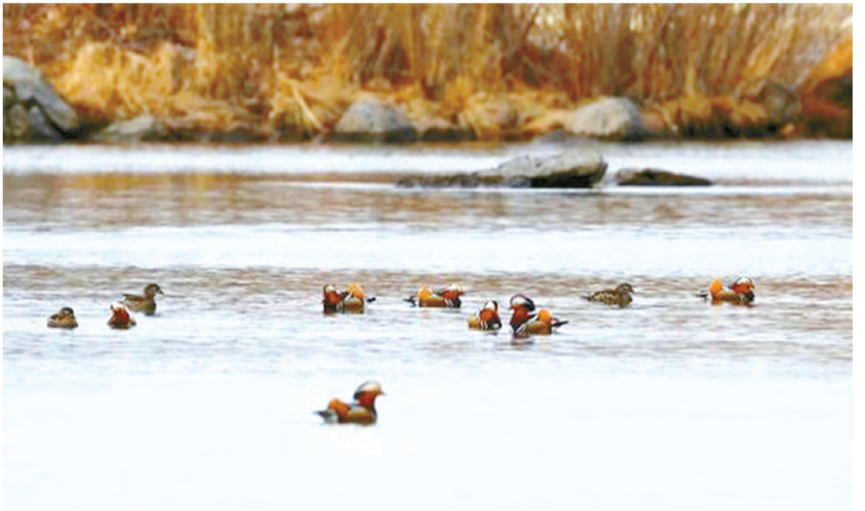
芳菲四月,冰雪消融。长白山脚下的白河小镇近日迎来百余只鸳鸯,平静的水面立马变得热闹起来。鸳鸯雌雄异色,雄鸟羽色鲜艳华丽,雌鸟周身灰褐色。鸳鸯一般成对出现,一起玩耍,一起觅食,一起梳理羽毛。