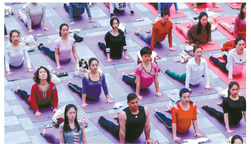
4月14日,瑜伽爱好者们进行瑜伽练习。当日,众多瑜伽爱好者在武汉武商广场共同展示瑜伽表演,展现健身魅力和运动快乐,倡导绿色生活理念。