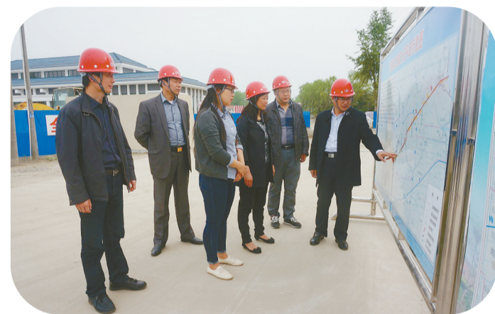
服务新交通 到重点交通工程进行职务犯罪预防

着力保障项目投资安全。聚焦危害政府投资安全的基础设施建设领域、惠民扶贫领域等开展专项行动,在基础设施建设、安全生产、惠民等领域查办窝案串案12人。坚持行贿受贿一起查,立案侦查围猎干部犯罪3人。开展定制化预防“体检”工作,被《检察日报》报道。健全安全生产、食品药品、环保领域的预防约谈工作机制,邀请盐城、东台两级人大代表、政协委员现场观摩,安全生产预防约谈工作机制获盐城市委政法委“十大法治事件提名奖”。