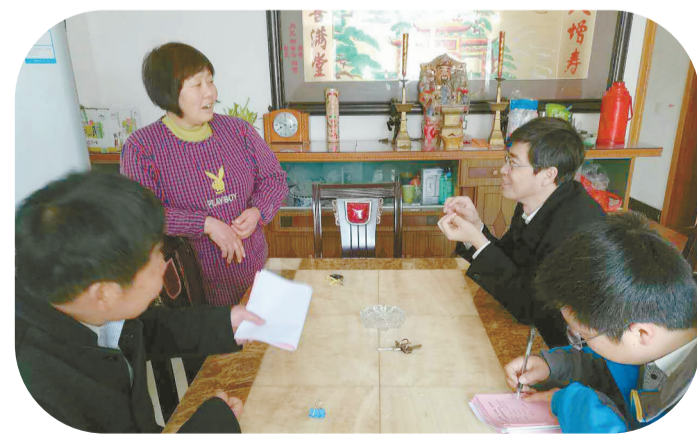
服务新生活 开展“大走访”,化解群众矛盾,致力精准扶贫