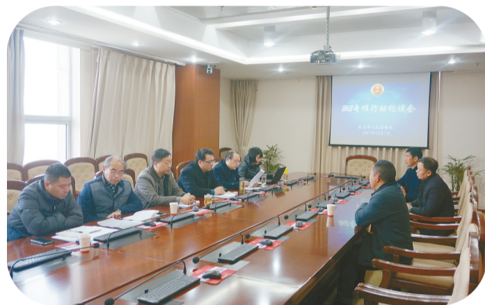
服务新生活 召开263专项行动约谈会

积极化解矛盾。深入开展“三到一处理”百日攻坚、“四查四清创三无”专项行动,全力做好检察环节矛盾风险防范化解管控工作,保障了全国两会、一带一路峰会等重要时段社会大局稳定。深入开展“访民情、促和谐”大走访大落实活动,干警走访群众1407户,电话走访207户,开展集体访谈15次,收集群众关于低保、土地征收等方面的意见建议136条,主动化解39件,其余意见建议分别移送相关职能部门处理,促进了基层和谐。