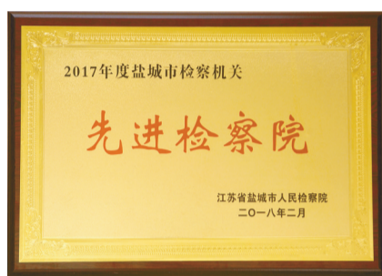
连续5年被盐城市检察院表彰为先进检察院

2017年以来,市检察院紧紧围绕市委“融入长三角、建设新东台”发展主题,制定出台服务保障市委重点工作十条措施、服务保障创建“国家全域旅游示范区”八项措施,用心服务“五个新实践”,充分发挥打击、监督、保护、预防等职能,推动检察工作与经济社会发展深度融合,全力服务发展大局。该院受到盐城市级以上表彰22次,连续5年被表彰为盐城市先进基层检察院。