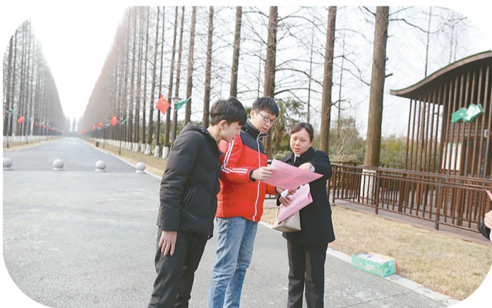
服务新旅游 深入黄海森林公园开展法制宣传,维护旅游市场法治秩序

切实强化执法联动。积极策应“263”专项行动,联合法院、环保局出台了《关于进一步加强环保领域非诉行政执法案件实施意见》,以点带面扩大监督规模,联合法院、环保局对全市生态环境问题进行集中整治,去年6月5日世界环境日之际,配合法院、环保局对8家企业、个体户进行集中强制执行,取得较好效果,相关做法得到最高检、省检察院肯定。