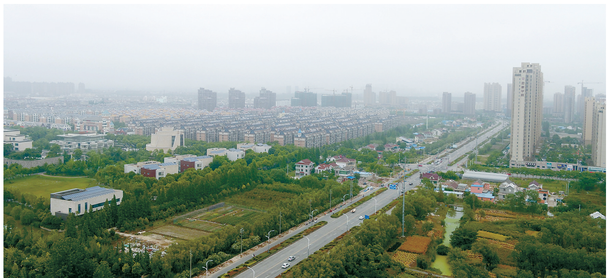
惠阳路中段(海陵南路-范公南路)道路拓宽改造工程已经正式启动。该工程全长2014.583米，总投资约6000万元，将原设计红线宽度40米拓宽至50米，与东西两侧的段面形式一致，中间为双向六车道。目前，道路两侧绿化带高大树木移栽工作已经完成。