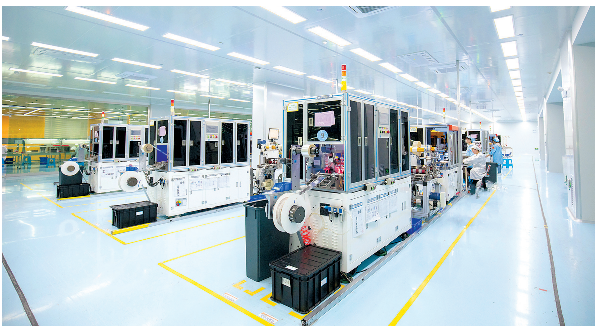
位于经济开发区的领胜城科技全面推进装备智能化、生产自动化，在竞争中抢占制高点，并积极打造智能制造示范企业，以智能制造作为提质增效创优势的核心抓手。图为W5无线充电模组智能制造车间。

会议听取市检察院关于开展公益诉讼工作情况的汇报。会议认为，市检察院自启动公益诉讼试点工作以来，主动担当、积极作为、履职尽责，公益诉讼工作成效显著，较好地保护了国家利益和社会公共利益。