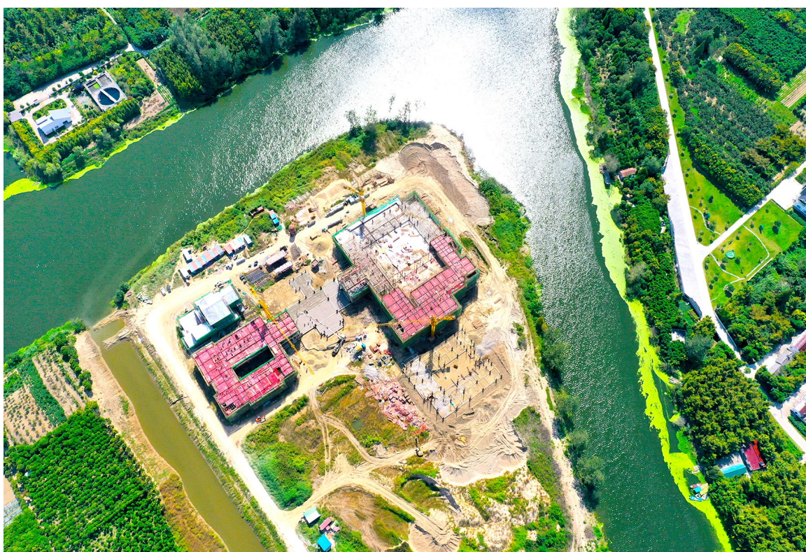
位于新街镇的得德·智慧健康岛项目总投资2亿元，以生态康养为主题，以智慧科技为依托，打造大健康产业综合体。项目规划涵盖中式高端酒店、智慧健康管理、健康教育培训、休闲景观等。

意见强调，要推进农业产业集聚培育，重抓“一镇一园一品”创建，强化质量监管和策划推介，不断叫响做优农业品牌。要在关键环节发力，推进农业科技集成。