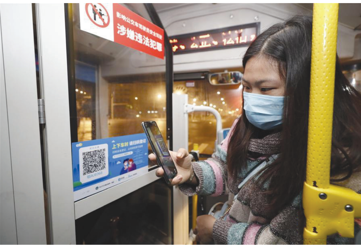
3月25日，在武昌火车站综合体站始发的首趟518路公交车上，乘客用手机支付宝APP扫码实名登记，显示健康绿码后方可乘车。当日起，武汉市部分公交车恢复开行。

——持续开展街面巡查和综合治理行动。公安机关、城市管理部门等要按照职责分工履行街面巡查职责，强化街面治安综合治理，有效减少“强行讨要”“职业乞讨”等不文明现象。同时，持续做好极端天气下的专项救助工作，确保不发生冻饿死亡等极端事件。 ——全力推进源头治理行动。流出地救助管理机构要建立返乡人员信息台账，做好信息对接和人员接收工作。各级民政部门要指导救助管理机构建立易流走失人员信息库，发现反复流浪乞讨的情况要及时反馈民政部门，原则上回访频率不低于每两月一次，回访期不少于一年。 ——全面提升救助管理干部队伍素质行动。市级及以上救助管理机构要在现有编制内合理调配人员，设置社会工作专业岗位和专职寻亲岗位，提升救助服务能力，培养专业化寻亲队伍。 ——全面开展照料服务达标行动。各地要集中部署开展救助管理和托养机构安全隐患排查行动，强化站内照料职责，有步骤、分批次开展托养人员站内接回工作。设施设备或人员不足、无法提供照料服务的救助管理机构，可以通过政府购买服务方式引入专业力量参与工作。 同时，各地要探索建立第三方监督委员会或特邀监督员制度，对救助管理机构和托养机构的运行管理、人员照料情况进行监督。救助管理机构要建立重大突发事件应急处置和信息报告机制，对机构遇灾、遇险，受助人员走失、死亡等异常情况，要第一时间报告民政部门。