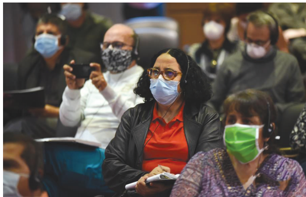
这是3月23日晚在委内瑞拉加拉加斯拍摄的视频会议现场。当地时间23日，中国同拉美和加勒比国家举行了视频会议，就新冠肺炎疫情防控开展交流。拉美和加勒比国家与会人士结合自身国情，就科学预防、早期诊断、公共政策等频频提问，中方专家一一解答。

提升用户端到端的网络感知体验。 另一方面，要加大资源统筹支持。要加大基站站址资源支持，加强5G用电和频率保障，保障网络快速建设运营，同时深化共建共享和5G异网漫游，降低运营企业运营边际成本。 “交通、电力等传统基础设施造就了工业化时代的奇迹，新一轮工业革命则需要新型基础设施赋能。5G新型基础设施建设不仅将从根本上改变移动网络的现状，促进数据要素的生产、流动和利用，还将让各行各业能够更便于联通协同、提供服务，带动形成万亿级元5G相关产品和服务市场。”王志勤说。