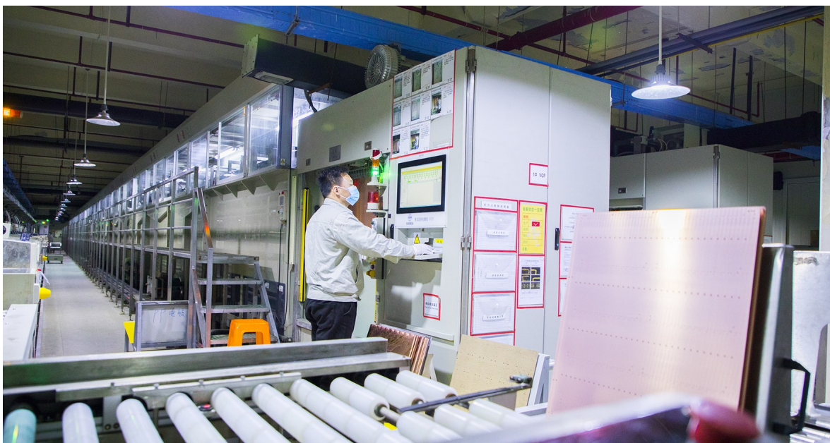
高新区贺鸿电子是一家专业从事多层高密度线路板、柔性线路板、刚柔结合板、陶瓷板等特种电路板生产的高新技术企业,其依托先进技术,抢占领域高地,实现全流程智能化生产。