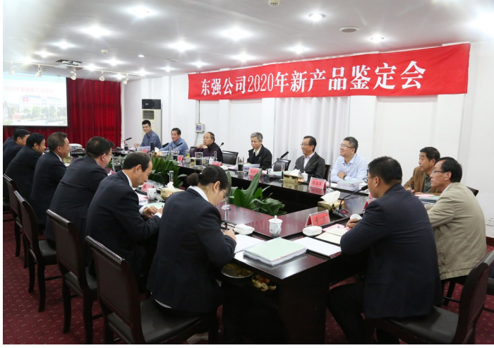
组稿：朱祥明 潘茂涛