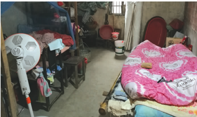
老母亲简陋的屋内