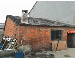
沈木荣老母亲居住的小屋