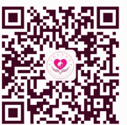
中医院微信二维码

注:1、专家坐诊限号30号(贺明20号) 2、四楼推拿科II为普通门诊,坐诊时间为周一~周五全天、周六上午,16号诊室 3、“●”为外请专家;“★”为镇江、丹阳名中医;“▲”为丹阳名中医