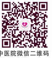
中医院微信二维码

电子产品普及后,干眼症在全球发病率明显增高。市中医院眼科主任高朝云表示,无节制使用电子产品,让不少年轻人饱受眼病折磨,除了干眼症,一些“老年眼病”也呈年轻化趋势。