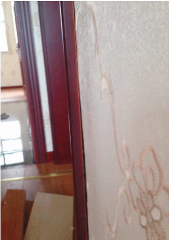
木门门套与墙壁之间有明显的缝隙