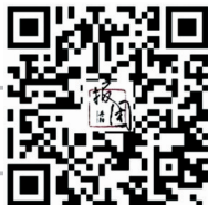
购买请用微信扫码

购买方式:只限丹阳报团淘宝、微信下单 咨询电话:86983129 13912814506