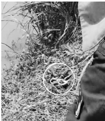
民警和消防官兵正在放生。