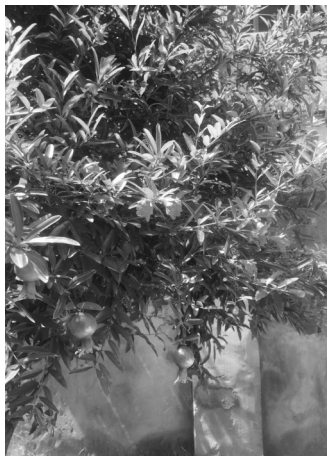
在老人的带领下,记者在云阳小区内找到的艾叶(左)、菖蒲(中)和石榴花(右)。记者 马骏 摄

今天是端午节,作为我国古老的传统节日之一,端午节距今已有2000多年历史。随着时代的发展,一些本地特色被淡化遗忘,端午在很多年轻人眼中成了