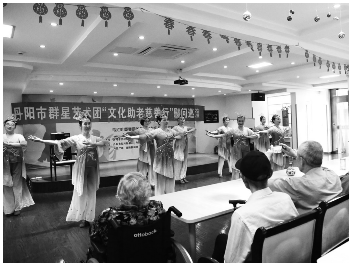
群星艺术团义工队和市慈善义工总队为老人们送去文艺大餐。记者 溢真 通讯员 卜杏兰 摄

部、万善园社区“爱之行”志愿者服务队与丹阳爱心义工社等都为困难家庭送去了粽子和节日的祝福。另外,我市群星艺术团义工队和市慈善义工总队为红叶颐馨园的老人们送去一场充满孝心的文艺大餐,齐梁义工社组织部分空巢老人和困境儿童出游,之后,义工们还教小朋友们包粽子,寓教于乐中,让孩子们感受传统佳节的魅力。