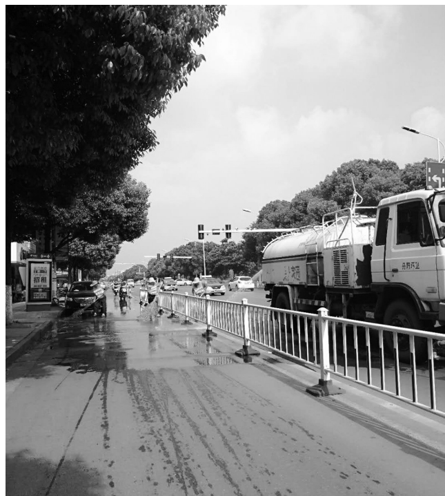
17日,环卫部门组织环卫工人,采用“人机相结合”的方式对城区主干道“大洗脸”。图为清洗现场。