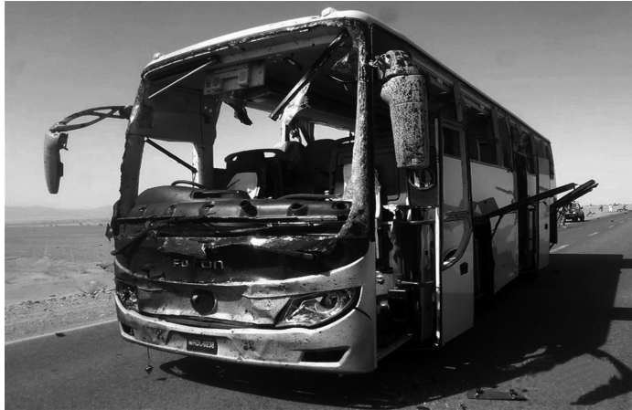
这是8月11日在巴基斯坦西南部俾路支省达尔本丁地区拍摄的车队遇袭现场。

目前,当地安全人员已封锁事发区域并展开调查。巴外交部新闻发言人在社交媒体发表声明,强烈谴责袭击事件,并表示巴基斯坦毫不畏惧此类“卑鄙的恐怖主义行径”。