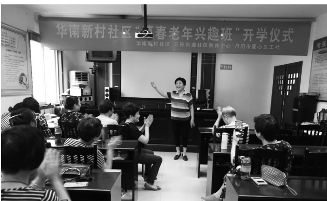
图为学员在教室内唱歌。

本报讯(记者 魏裕隆 通讯员 李淑君)“我爱你中国,我爱你春天蓬勃的秧苗,我爱你秋日金黄的硕果……”9月17日上午9点半,活动室内歌声嘹亮、热闹非凡,20余名老年朋友齐聚在这里,参加了社区开设的老年兴趣班声乐第一课。