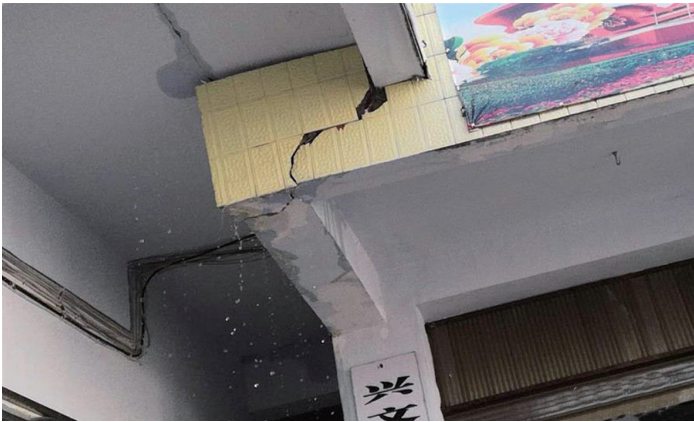
12月16日,宜宾市兴文县城一处建筑在地震后出现裂缝。

新华社成都12月16日电 据中国地震台网正式测定:12月16日12时46分在四川宜宾市兴文县(北纬28.24度,东经104.95度)发生5.7级地震,震源深度12千米。记者了解到,地震发生后,宜宾市、成都市、重庆市等多地有明显震感。 记者从四川省地震局了解到,震中距兴文县城29公里,距珙县32公里、距长宁县38公里、距筠连县44公里,距云南威信县45公里,距宜宾市64公里,距重庆市215公里。宜宾、成都、重庆等地市民在地震时均有明显震感。 从当地居民拍摄的视频中记者看到:地震发生时,有的居民家中的吊灯长时间剧烈晃动;一家小超市内的商品被摇落到地面;一些地区的农房墙壁上出现X型裂纹,不同程度受损。 记者从四川省地震局获悉,截至目前,宜宾市兴文县5.7级