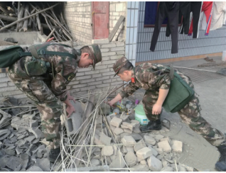
12月16日,在兴文县周家镇龙洞村,救援人员在进行抢险救援工作。

结,随时可赶赴现场。当地政府正全面开展灾情核查、抢险救灾、伤员救治等工作。 这位负责人表示,地震发生后,应急管理部党组书记黄明、副部长郑国光立即赶到部指挥中心,调度了解受灾情况,部署抢险救灾工作,要求迅速分析研判震情趋势,快速高效实施救援,科学调度人员物资。 据中国地震台网测定,此次地震震中距离兴文县城约20千米,距宜宾市约70千米,距成都市约270千米,震中50千