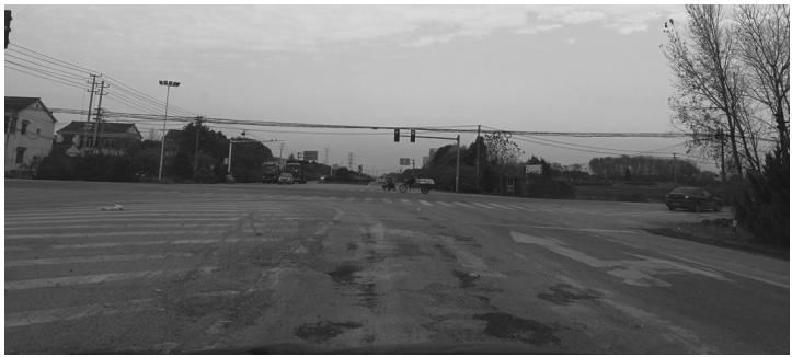
图为丹西公路与122省道十字路口坑洼不平的路面。

本报讯 (记者 王国禹)“丹西公路和122省道十字路口的南侧道路实在太坑人了,车子经过这里总是颠簸起伏,可谓‘步步惊心’。”17日上午,市民钟先生致电本报记者,希望借本报一隅,呼吁有关部门尽快将这“坑人”的破路修复。