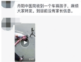
丹阳中医院收到一个车祸孩子,麻烦大家转发。到目前没有家长信息。